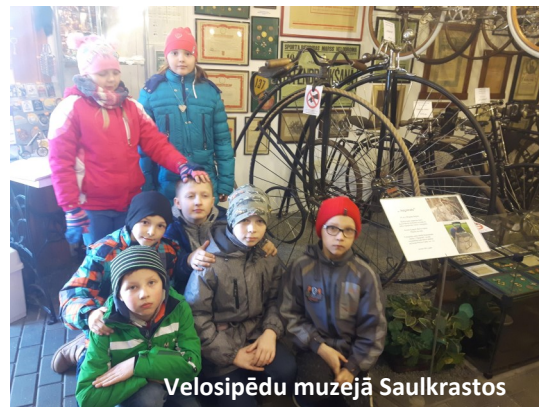
Velosipēdu muzejā Saulkrastos

darbojās un iepazīna profesijas pamatus. Kļūstot par aktīviem dalībniekiem, tika radīta dziļāka