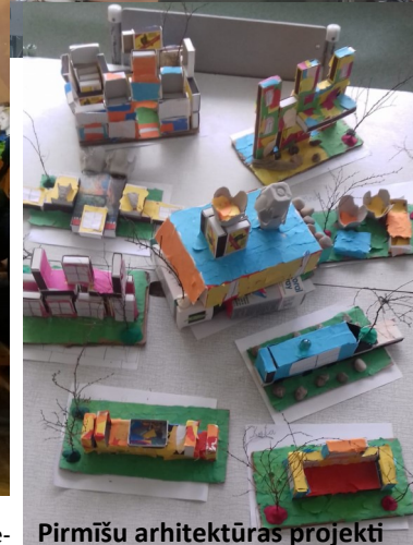
Pirmīšu arhitektūras projekti