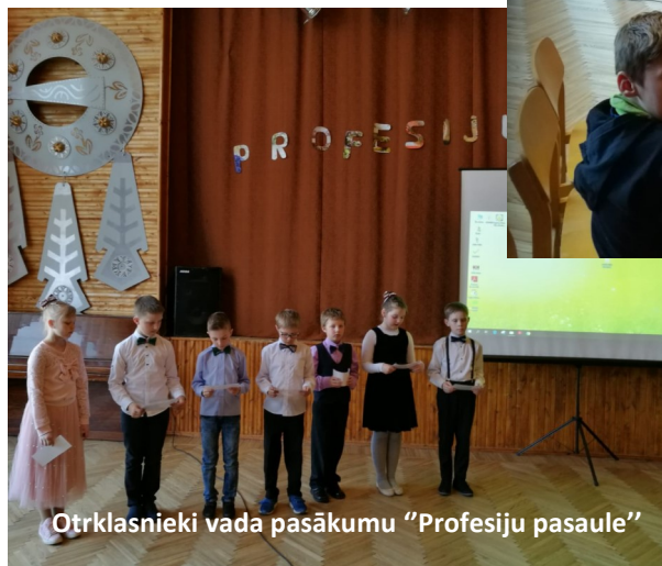
Otrklasnieki vada pasākumu "Profesiju pasaule"

kām virtuālās puzzles un atbildējam uz dažādu profesiju pārstāvju video jautājumiem. Paldies pedagogiem, skolēniem par aktīvu līdzdalību! Ceru, ka katram no mums projekta laikā bija iespēja atvērt savas durvis uz pasauli un ielūkoties sevī!