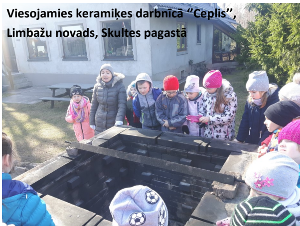
Viesojamies keramiķes darbnīcā "Ceplis", Limbažu novads, Skultes pagastā