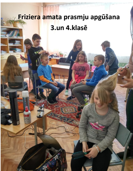
Friziera amata prasmju apgūšana 3.un 4.klasē

pasākumu "Profesiju pasaule", mācoties sadarbības prasmes, apzināties sevi kā radošu personību. Pasākums bija kā kopveselums, rezultāts iegūtajām zināšanām, attieksmēm un prasmēm, īstenojot caurviju prasmes, lietpratību, pašvadību un pašizziņu. Izmantojot interaktīvās tehnoloģijas, pildījām erudītu, spēlējām atmiņas spēles, li-