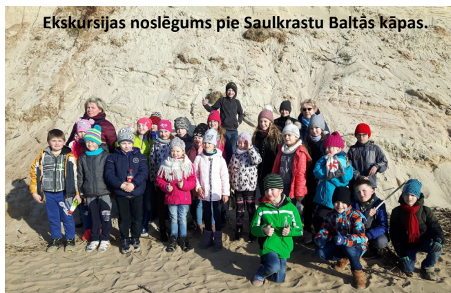
Ekskursijas noslēgums pie Saulkrastu Baltās kāpas.