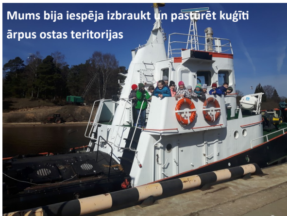
Mums bija iespēja izbraukt un pāstūrēt kuģīti ārpus ostas teritorijas

darbojās un iepazīna profesijas pamatus. Kļūstot par aktīviem dalībniekiem, tika radīta dziļāka